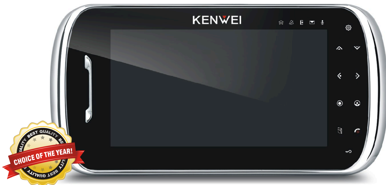
KW-S704C_B / KW-S704C/W200_B