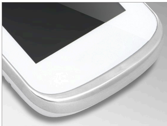
KW-S704C_W / KW-S704C/W200_W

KW-128C, KW-129C, KW-S701C, KW-S700C, KW-112B, KW-S702C, KW-703FC, KW-S704C