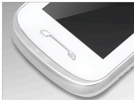
KW-S704C_W / KW-S704C/W200_W

Wysoka jakość użytych materiałów, szerokie możliwości rozbudowy oraz bogactwo funkcji dodatkowych zadowolą wymagających użytkowników, dla których system wideodomofonowy to coś więcej niż tylko obsługa wejść.