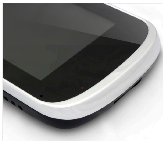
KW-S704C_B / KW-S704C/W200_B