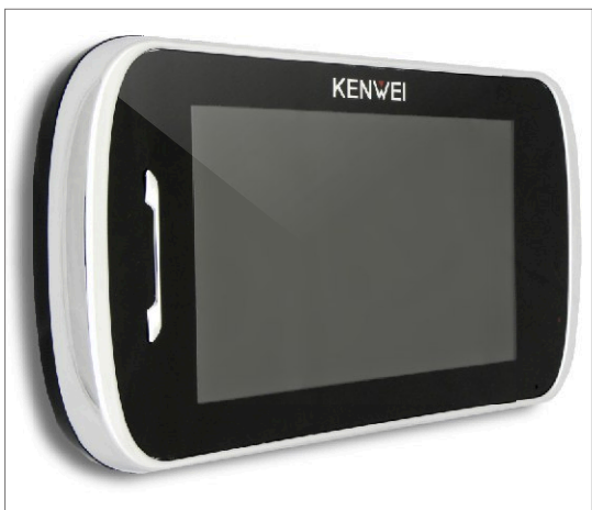
KW-S704C_B / KW-S704C/W200_B

Współpracuje ze wszystkimi 4 przewodowymi panelami bramowymi KENWEI