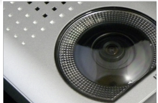
Panel KW-138EMC z czytnikiem kluczy elektronicznych

Panel bramowy KW-138M / KW-138MC został zaprojektowany dla nowoczesnych systemów wideodomofonowych. W zależności od wersji wewnątrz panela znajdują się czarno-biała lub kolorowa kamera CCD o wysokiej czułości , która zapewnia doskonałą widoczność w każdych warunkach. Duży kąt widzenia, 76° w poziomie oraz 65° w pionie, gwarantuje komfortową widoczność osób przed panelem bramowym. Dodatkowo umożliwiliśmy 20° regulację kątów widzenia w dowolnym kierunku. Panel bramowy KW-138M / KW-138MC zaprojektowaliśmy jako jedno- lub dwu-abonamentowy. Wykonaliśmy go z bardzo wytrzymałych stopów aluminium-magnezowych gwarantujących odporność na warunki atmosferyczne. Montaż natynkowy z możliwością dołożenia ochronnego daszka.