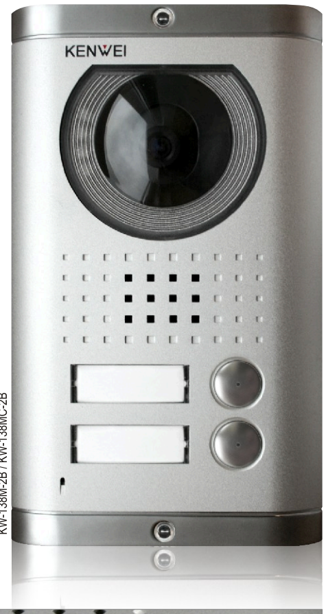
KW-138M-2B / KW-138MC-2B