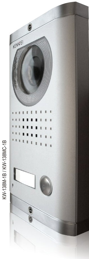
KW-138M-1B / KW-138MC-1B