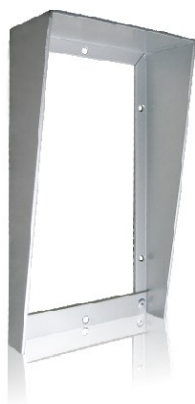
Aluminiowa ramka z daszkiem do paneli KW-138M, KW-138MC, KW-138EMC