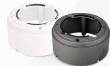
Pierścień mocujący EVX-CD-BI