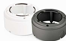
Pierścień mocujący EVX-CD-B1