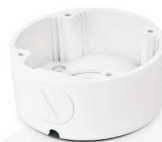
Pierścień mocujący EVX-C-B16