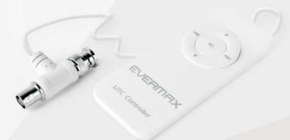
Kontroler zdalnego sterowania EVX-UTC-CR1