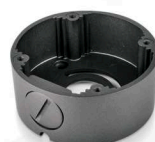
Pierścień mocujący EVX-C-B14