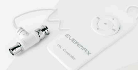
Kontroler zdalnego sterowania EVX-UTC-CR1