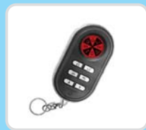
Dwukierunkowy pilot LCD