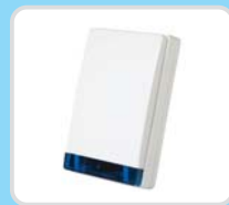
Bezprzewodowa zewnętrzna syrena