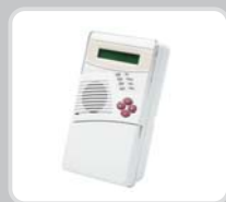
Dwukierunkowa klawiatura LCD