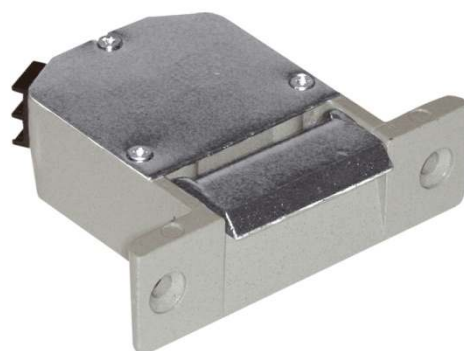
Podstawowe wymiary zaczepu R1